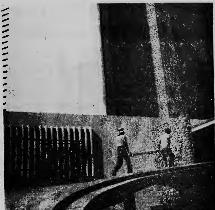
Riba e foto mas ariba nos ta mira e entrada cu ta bai na e lobby. Aki henter dia nan ta transporta material hiba paden.

E trabanonan na Aruba Caribbean Hotel ta avanzando y poco-poco nos ta bai descubriendo, kiko senior Morris Lapidus a imagina su mes ora cu e tabata trahando e plannan. Riba e prome piso e cambianan di hotel tur tin nan articulonan sanitario instala caba mayormente y e muranayan a hanja nan verf den tintanan moderno caba. Tambe den barnan, comedornan y lobby tin varios obrero ta trahando.